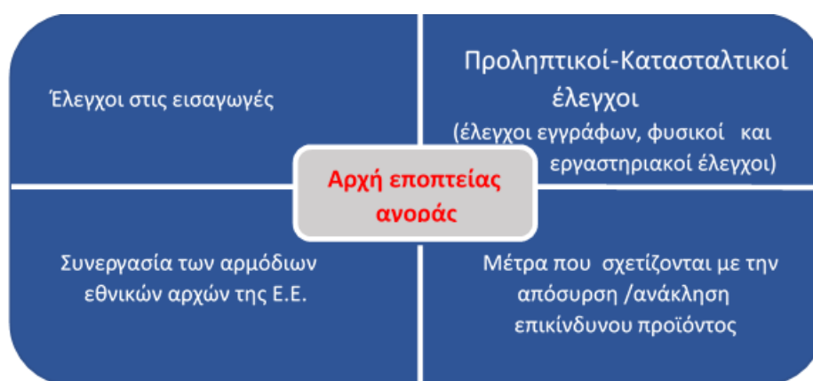
Σχήμα 2: Ενέργειες Εποπτείας Αγοράς

Οι ενέργειες στις οποίες προβαίνουν οι αρμόδιες αρχές εποπτείας της αγοράς παρουσιάζονται σχηματικά στο ακόλουθο σχήμα: