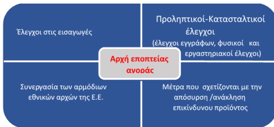
Σχήμα 2: Ενέργειες Εποπτείας Αγοράς

Οι ενέργειες στις οποίες προβαίνουν οι αρμόδιες αρχές εποπτείας της αγοράς παρουσιάζονται σχηματικά στο ακόλουθο σχήμα: