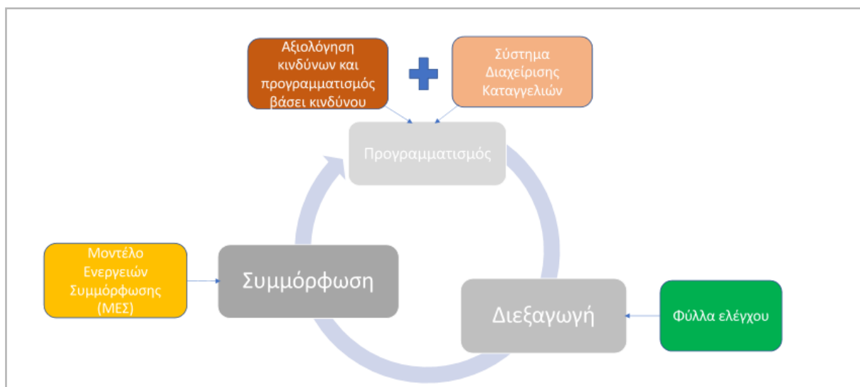
Εικόνα 1: ΜΕΣ και Κύκλος Εποπτείας

Η θέση του ΜΕΣ στον κύκλο εποπτείας, απεικονίζεται στην παρακάτω εικόνα: