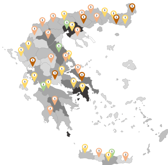
Χωρική ανάλυση ΟΥΜΕΔ σε σχέση με την Ακαθάριστη Προστιθέμενη Αξία ανά Περιφερειακή Ενότητα