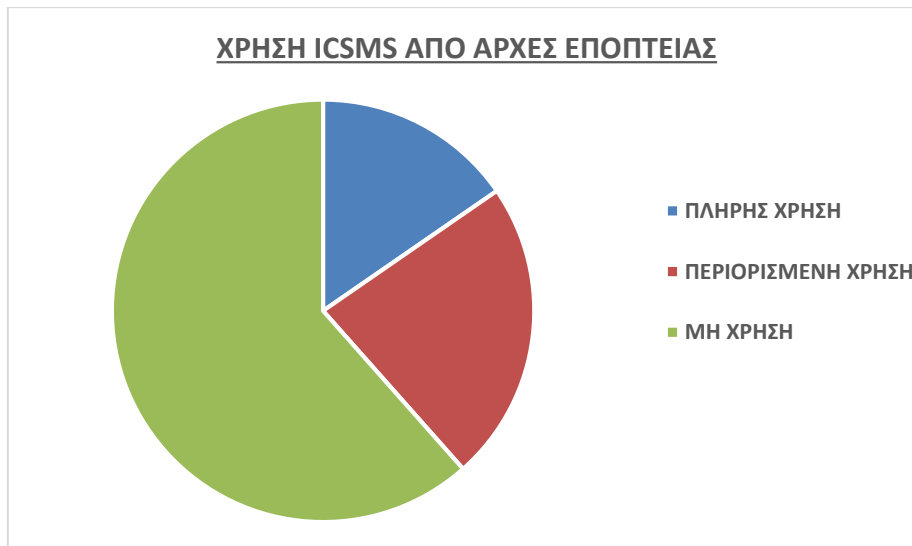
Διάγραμμα 3: Χρήση του ICSMS από τις Αρχές Εποπτείας

Το ΕΓΣ είναι ο εθνικός διαχειριστής του ICSMS και έχει την ευθύνη για την καταχώρηση νέων αρμόδιων Αρχών και διαχειριστών Αρχών στο σύστημα, τη συνεργασία με τα σημεία επαφής άλλων Αρχών Εποπτείας της αγοράς, καθώς και τη συνεχή συνεργασία με την Ε. Επιτροπή.