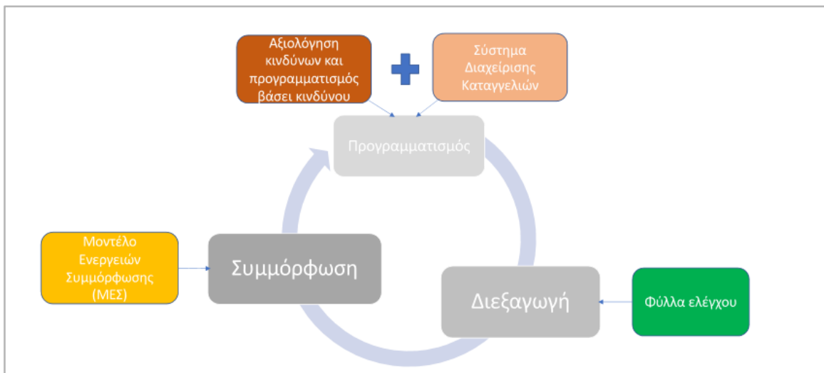
Διάγραμμα 2: Ο κύκλος της εποπτείας

Με τον ν. 4512/2018 εισάγεται μια συνολική μεταρρύθμιση των γενικών αρχών και διαδικασιών για την άσκηση εποπτείας των οικονομικών δραστηριοτήτων και των προϊόντων στη χώρα, η οποία ευθυγραμμίζεται σε μεγάλο βαθμό με τις αρχές του Κανονισμού και αποτελεί τη βάση εφαρμογής της εποπτείας. Ο «Κύκλος Εποπτείας» στον οποίο βασίζεται το εθνικό πλαίσιο έχει ήδη θεσμοθετηθεί για την εποπτεία των προϊόντων αρμοδιότητας της ΓΓΒ (καθώς και σε Αρχές που ρυθμίζουν άλλα πεδία εποπτείας).